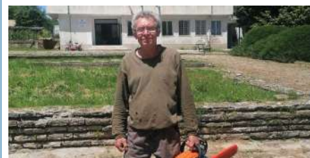
Закупени са и допълнителни машини за подрязване на храсти и ръчни косачки в община Вълчи дол