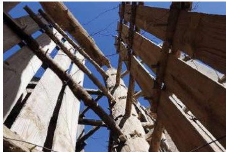
Вятърни мелници на повече от 1000 години, село Наштифан, Иран.

Историята на вятъра като източник на енергия датира от хиляди години. Още през 5000 г. пр.н.е. египтяните вече са използвали вятърна енергия, за да задвижват своите лодки по река Нил. До 200 г. пр.н.е. в Китай са били използвани прости водни помпи, задвижвани от вятъра.