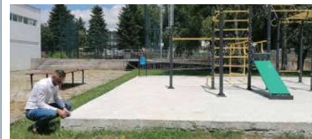
Оглед в СУ „Васил Левски“, Вълчи дол, по покана на директорката на училището за планиране на ремонти