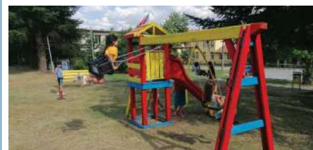
Ремонт на детската площадка в село Михалич