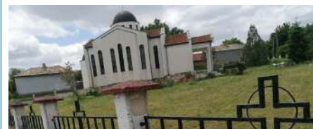
Осигурени са материали за рехабилитация на оградата на храма в село Искър