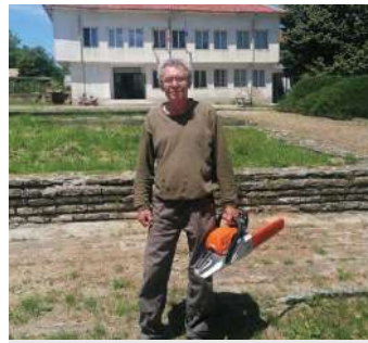
Служител, назначен по 6 месечната програма, спонсорирана от „Добротич Уинд“ АД с чисто нова резачка Stihl / с. Калоян.

Нашата социална дейност продължава активно на територията на община Вълчи дол и през летните месеци. Продължава програмата за облагородяване на зелените площи в общината на стойност 36 000 лева за осигуряване на 6 нови временни работни места, стартирала през месец април. Закупени са и допълнителни машини за подрязване на храсти и ръчни косачки, които вече се използват по предназначение.